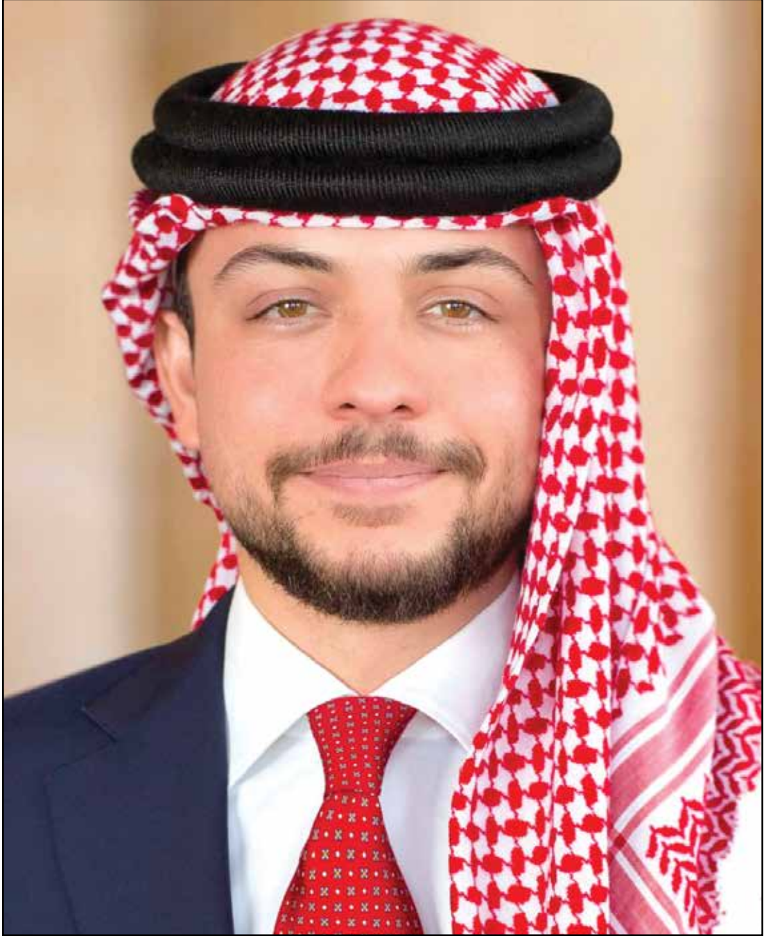
حضرة صاحب السمو الملكي الأمير حسين ابن عبدالله الثاني ولي العهد