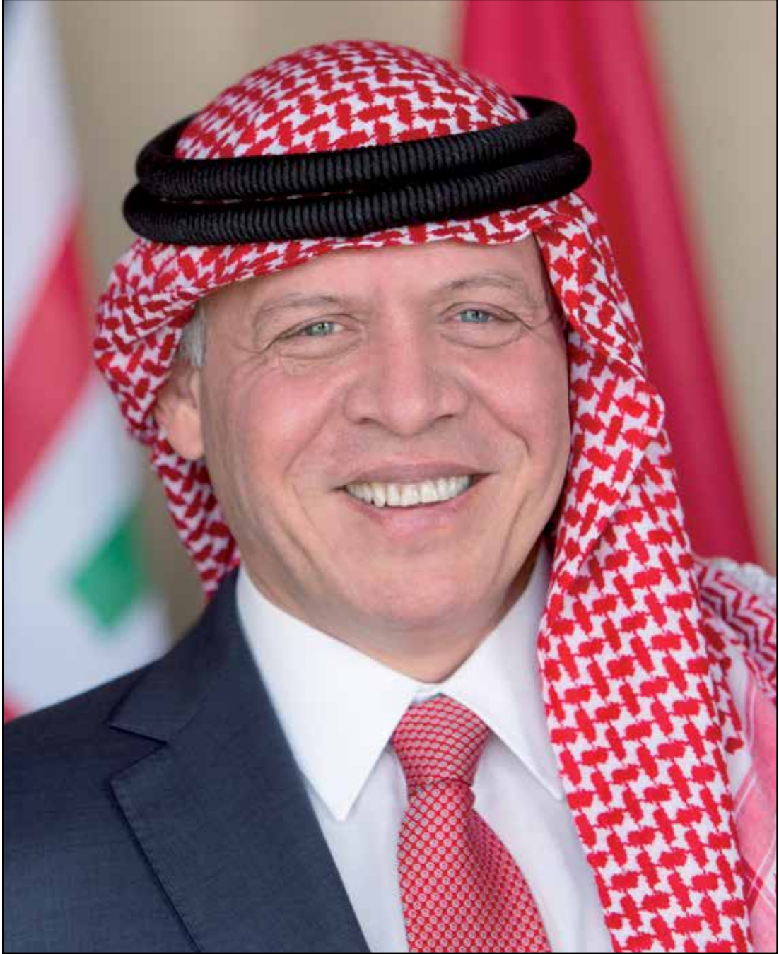
حضرة صاحب الجلالة الملك عبدالله الثاني ابن الحسين المعظم